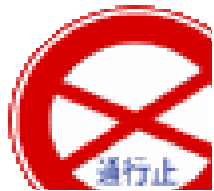
つうこうど 通行止め 禁止通行