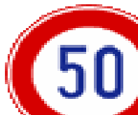
さいこうそくど 最高速度 最高速度