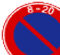
ちゅうしゃきんし 駐車禁止 禁止停车