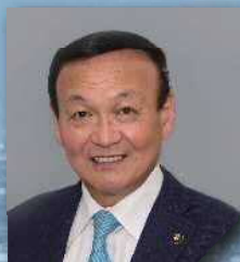
藤井 裕久 富山市長