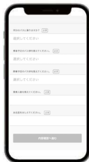
スマートフォンの 予約イメージ