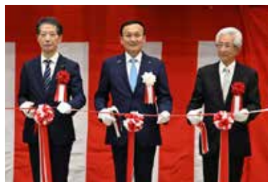
▲テープカットの様子

あいの風鉄道水橋駅から徒歩3分です。利用には事前の使用申請と利用料が必要です(児童館は除く)。詳細は、市ホームページ(「水橋会館」で検索)をご覧ください。