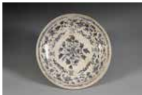
青花牡丹文盤(ベトナム)