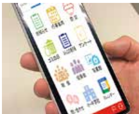
電子回覧板アプリ