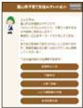
AIが質問に回答する「子育て支援AIチャットボット」