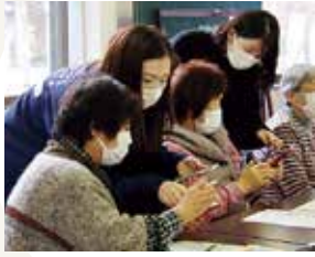
スマホ買い物支援