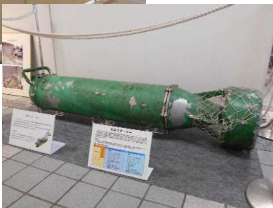
スタッフが使用したと思われる水中スクーター