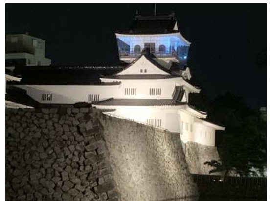
ライトアップイメージ

拉致被害者の救出を願うシンボル「ブルーリボン」にちなみ、12月10日(日)から27日(水)の間、富山城天守閣を青色でライトアップします。