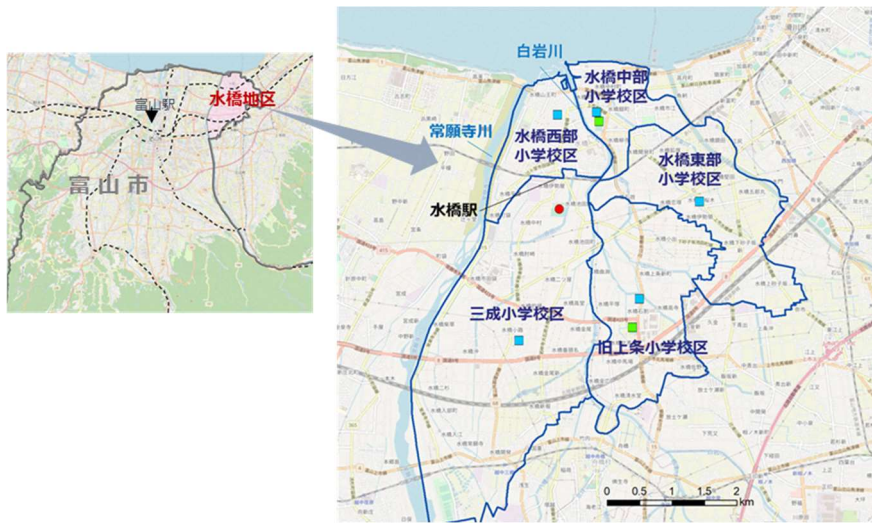
图 7-1 事業対象位置図（校区）