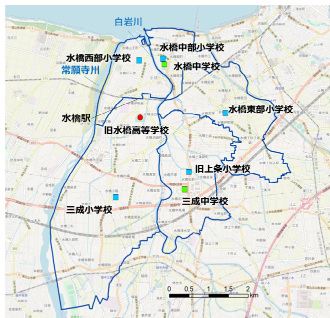
图 7-2 統合元学校及び水橋高等学校位置図