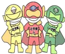
富山市元気っ子戦隊うまいんジャー

脳はブドウ糖のみをエネルギー源とするため、朝ごはんにお米やパンなどの炭水化物をしっかりと食べると、脳が活発に働くようになり、集中力がアップして、けがの防止や学力の向上につながります。