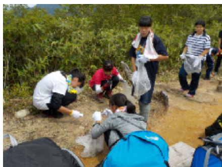
清掃活動の様子 (三角点・薬師岳山頂)

(参考) 新型コロナウイルス感染拡大の影響で令和2、3年度は中止。令和元年度以前の様子