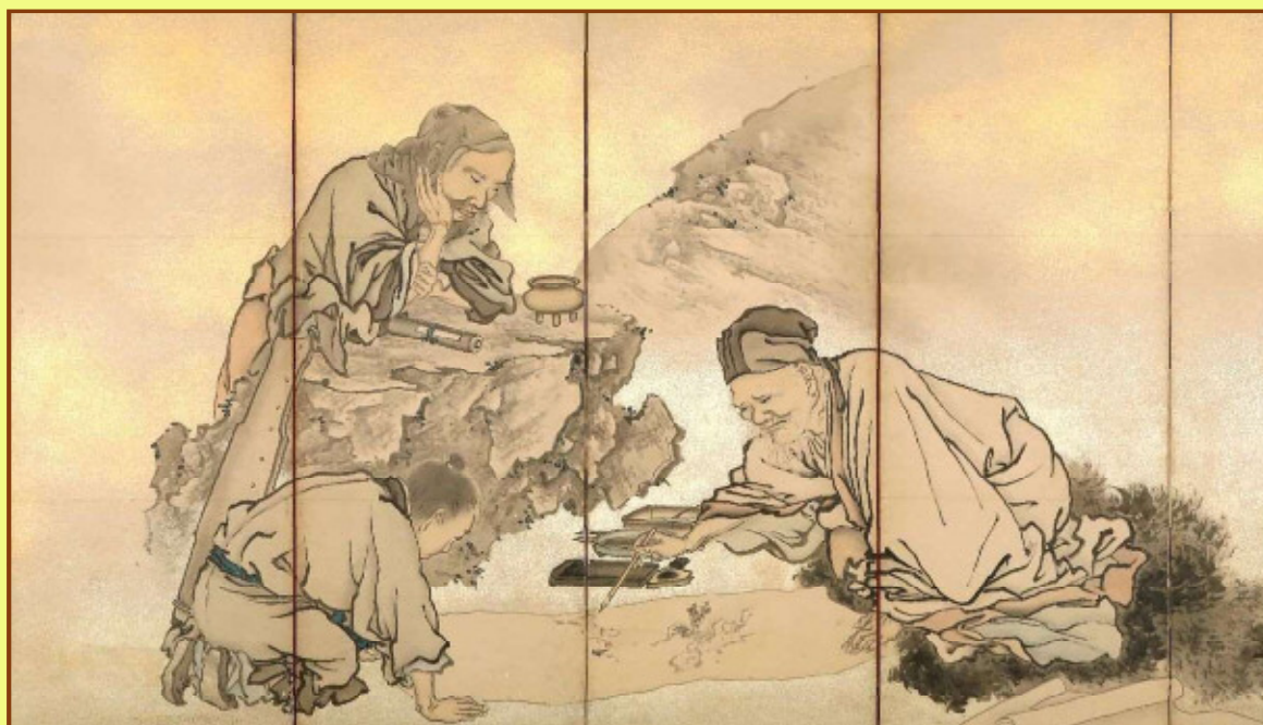
岸駒《琴棋書画図屏風》江戸時代 右隻 部分 当館蔵