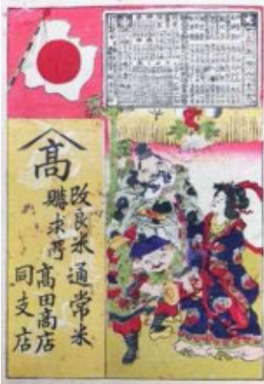
改米通常米請求所 高田商店 (当館蔵)