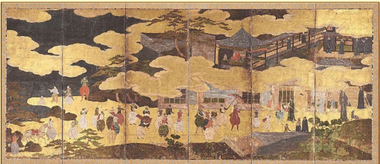
《南蛮屏風》江戸時代 当館蔵

その昔、調度品として重宝された屏風。現代では、生活習慣の変化などにより家に屏風を広げることは、ほとんどなくなってしまいましたが、かつては風除け、目隠し、間仕切り、そして室内装飾として住生活に欠かせない調度品でした。絵師たちは、折り広げられる屏風の形状を踏まえ、工夫を凝らして、その腕をふるっています。屏風絵は、一扇一扇に12カ月の風物を描いた月次絵や、各扇を繋いだ大画面に自然の景観を描いた風景画、また歴史的な戦の場面を描いた合戦絵、さらには南蛮人の渡来・風俗を描いたものなど、実に多種多様な主題で描かれ、見る者を魅了したのです。かつて人々の住生活を彩った屏風。本展では、景色や風物を讃える時や、趣ある、心ひかれるという意味で使われた古語「おもしろし」の視点から、屏風絵の世界をご紹介します。