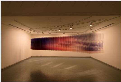
中西信洋(Layer Drawing-Light of sunset) 2016年、H1000×W1000mm×40シート インクジェットプリント・フィルム 作家蔵、©Nobuhiro Nakanishi, Courtesy of Yumiko Chiba Associates