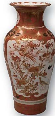
「景岸焼 色絵花鳥美人文瓶」

古来より日本人は、花や鳥に親しみを寄せ、月や風に心を遊ばせてきました。四季折々の自然の姿を眺め、季節の移ろいにしみじみとした情緒を感じ、日々営まれる生命の歓びを感受する—こうした風雅な心は花鳥風月と呼ばれ、今日においても、わたしたち日本人の美意識や価値観の底流をなしています。花鳥風月は、平安時代以降「もののあわれ」を伝えるイメージとして、和歌や随筆などの文学作品に織り込まれ、同時に日本人の自然観をあらわす主題として、絵画や工芸品の意匠にも多く採り入れられてきました。富山ゆかりの美術作品の中にも、こうした花鳥風月の趣を感じさせる作品が、主に江戸時代以降に多く残されています。森記念秋水美術館、富山市郷土博物館との連携企画として開催する本展では、郷土博物館と当館が所蔵する約30点を展示し、日本美術が織り成す繊細優美な花鳥風月の世界を紹介します。