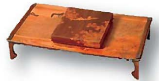
「木象嵌桜御所車紋文白木象嵌楓舟遊紋硯箱」