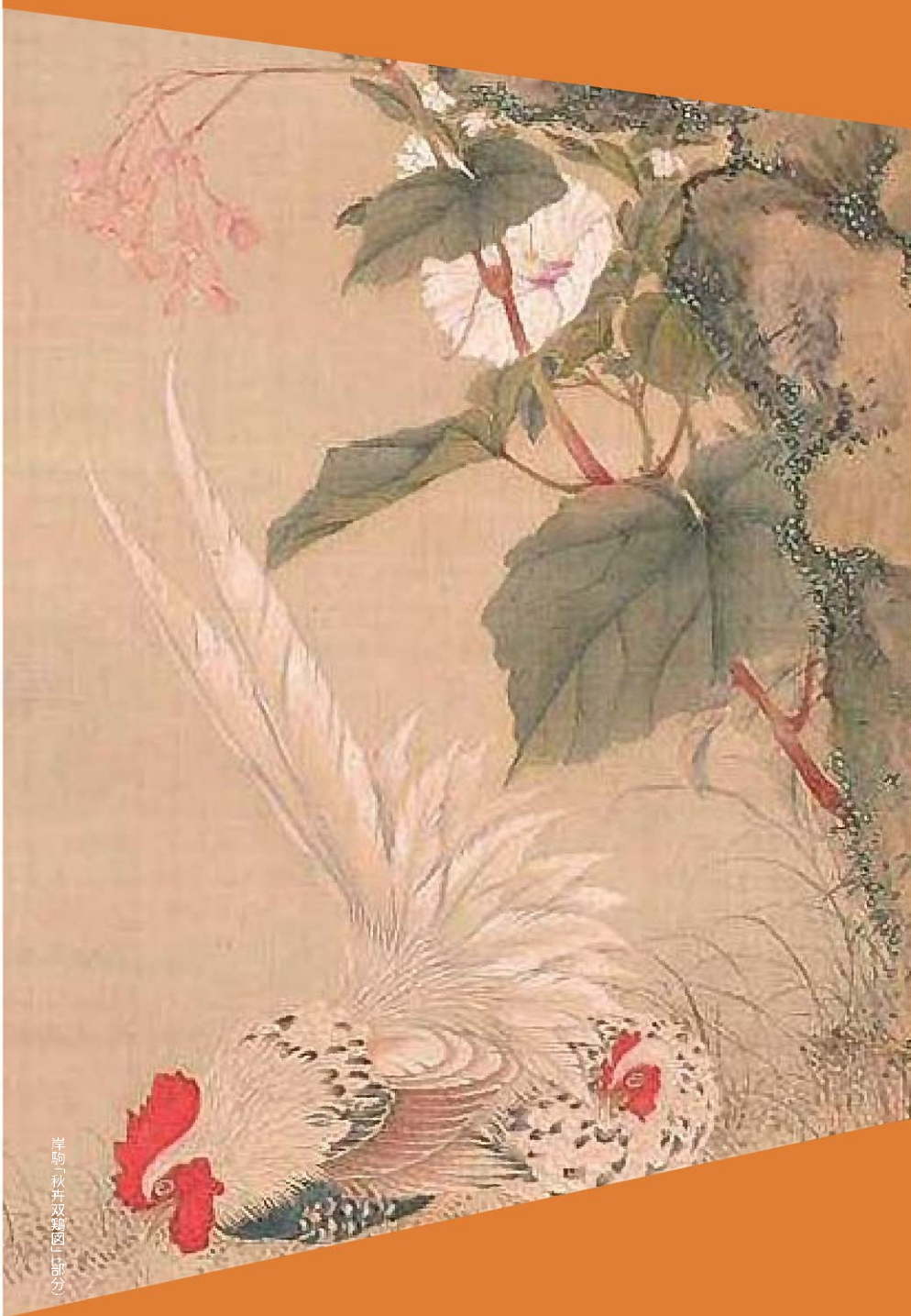
岸駒「秋并双鶏図」一部分