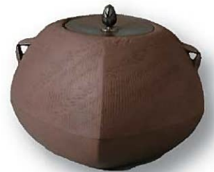
初代畠春齋「竹林文菱形釜」