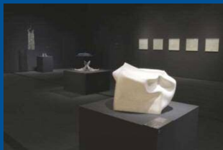
コレクション展 富山ガラス大賞展に向かって 会場風景

TOYAMA INTERNATIONAL GLASS EXHIBITION 2021