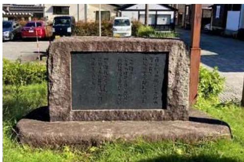
吉井勇歌碑 (富山市八尾町上新町)

本展の「とやま」文学作品を通じて、富山市の魅力を再発見し、その豊かな自然や風土の一面を紹介できれば幸いです。