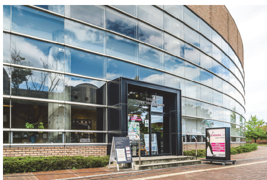
TOYAMA TOWN TREKKING SITE (富山市総合体育館内)