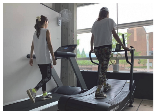
TOYAMA TOWN TREKKING SITE 電動式(左)・自走式(右) ランニングマシン