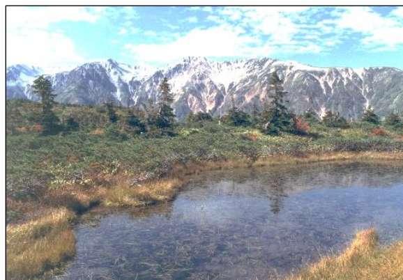
薬師見平から見た薬師岳のカール

期間 : 10月17日(土)~12月13日(日) 開館時間: 9:30~17:00(入館は16:30まで) 休館日: 月曜日、祝日の翌日 入館料: 大人100円 高校生以下は無料