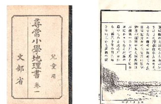
地理の教科書(大正14年)