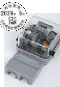
電気メーター (有効期間10年) ※一部を除く。