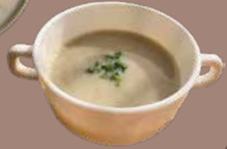
里芋とごぼうのポタージュ