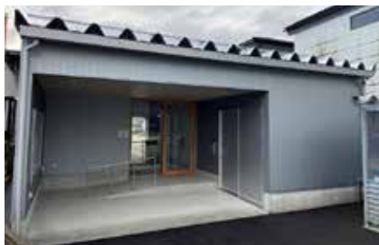
☎ 市民生活相談課 ☎443-2046

(一助)自治総合センターによる宝くじ社会貢献広報事業のコミュニティ助成を受け、新庄町第四町内会は、コミュニティセンターを建設しました。