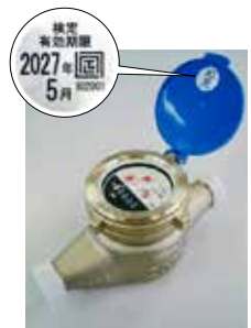
水道メーター (有効期間8年)

メーターの見方がわからない時や、期限が過ぎていた場合の対応など、不明な点については問い合わせてください。