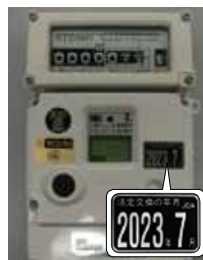
ガスメーター (有効期間10年) ※一部を除く。

このメーターには計量法で検定の有効期間が定められています。期限切れのメーターを使用して料金を算定することは、計量法違反であり、罰則の対象となります。