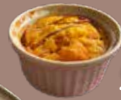
りんごのクラフティ