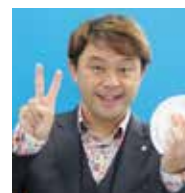
コンプレッサーさん