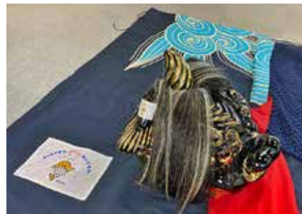
☑図市民生活相談課 ☎443-2046

(一財)自治総合センターによる宝くじ社会貢献広報事業のコミュニティ助成を受け、笹倉運営協議会は、獅子頭などの獅子舞用備品を整備しました。