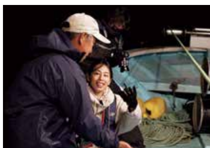
シロエビ漁船取材の動画はこちら

富山の自然の豊かさ、風景の素晴らしさ。私たちが普段味わう食には、それを支える生産者の思いや努力があるということを、動画を通して伝えています。