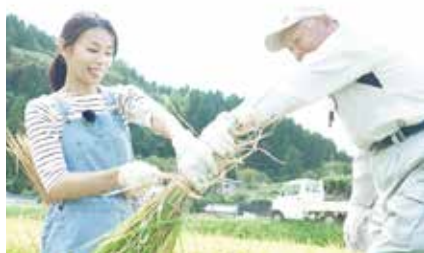
稲刈り体験の動画はこちら