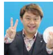
コンプレッサーさん