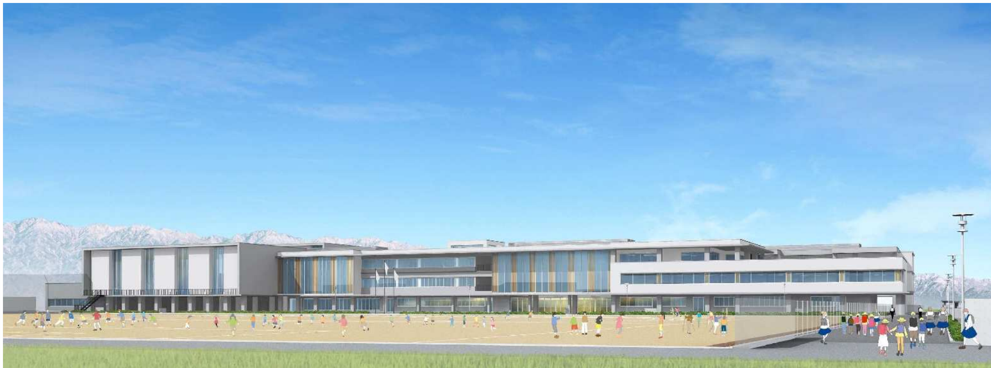
施設全景(北側透視図)