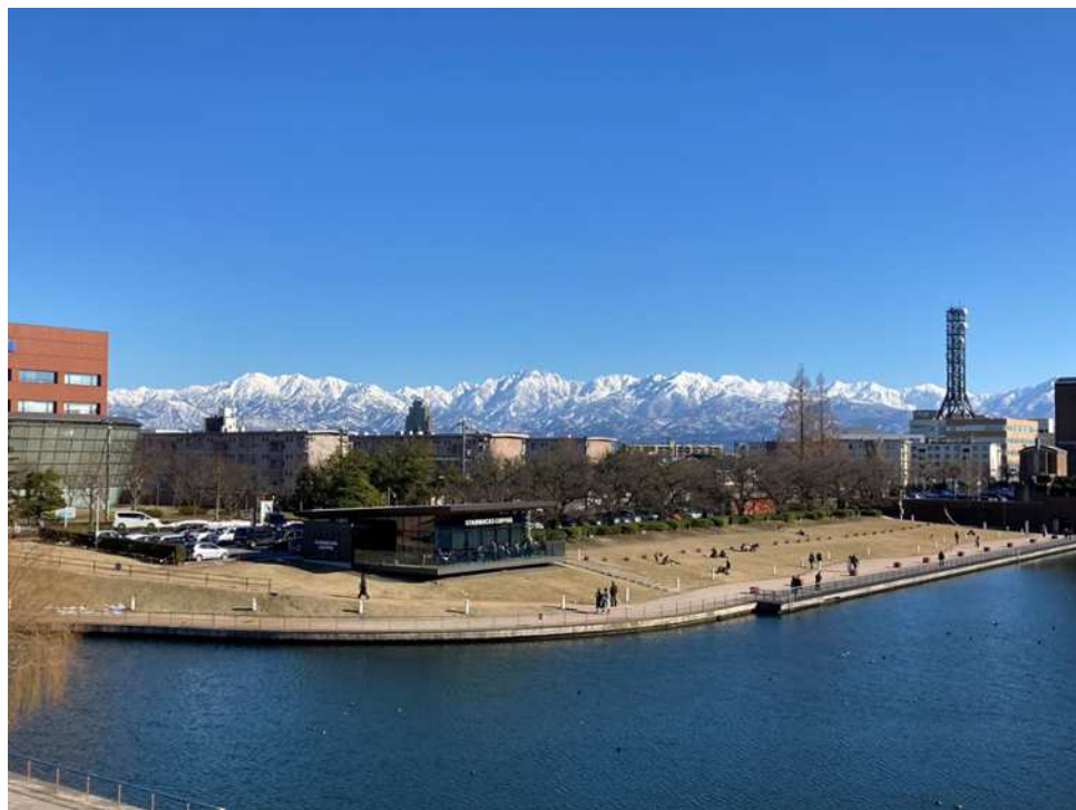
富岩運河環水公園天門橋