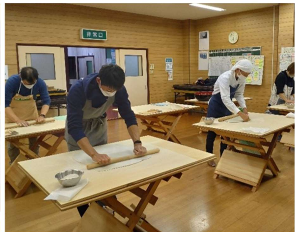
左上:特産物のりんご園、右上:牛岳スノーフェスタの花火 左下・右下:地域住民による、りんご祭・そば祭りの様子