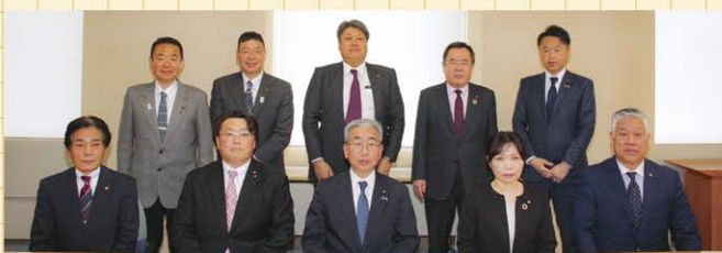
新たな議会報編集委員会委員

※ご意見等については、類似したものをまとめ、要約して掲載しております。市民の皆さまから、このほかにもたくさんのご意見・ご要望をいただき、ありがとうございました。お寄せいただいたご意見は、今後のとやま市議会だよりの企画・編集の参考にさせていただきます。