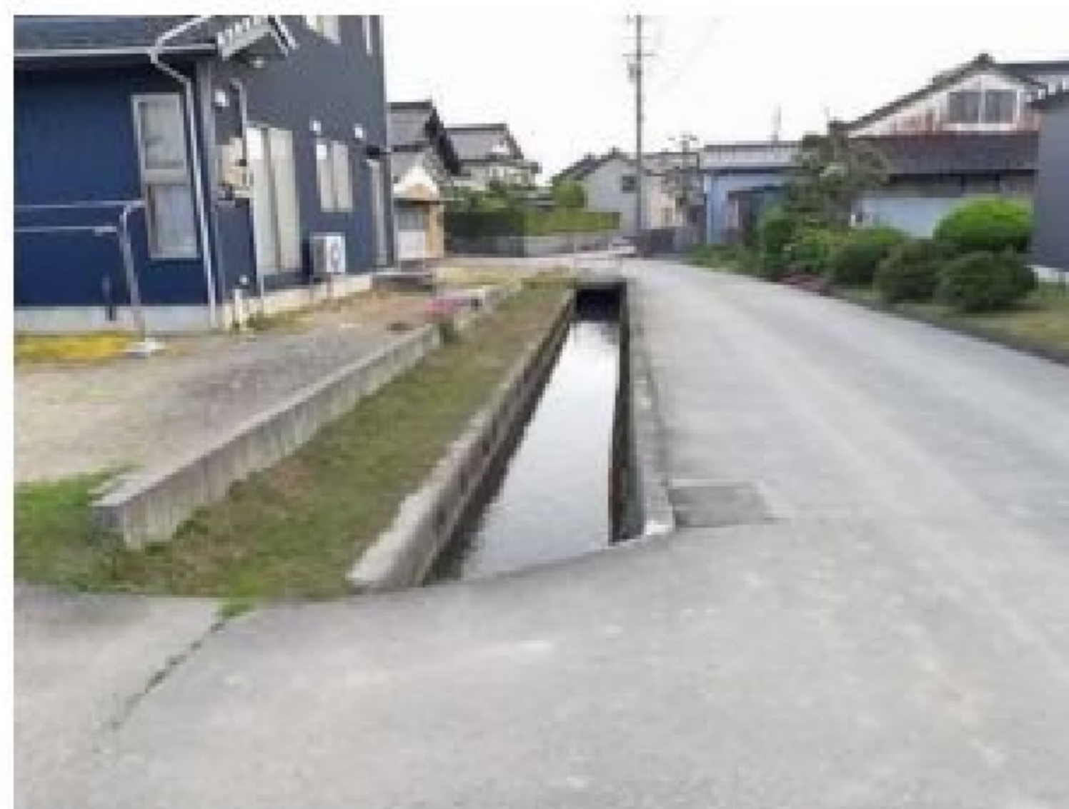
集居集落を流れる農業用水路(射水市内)