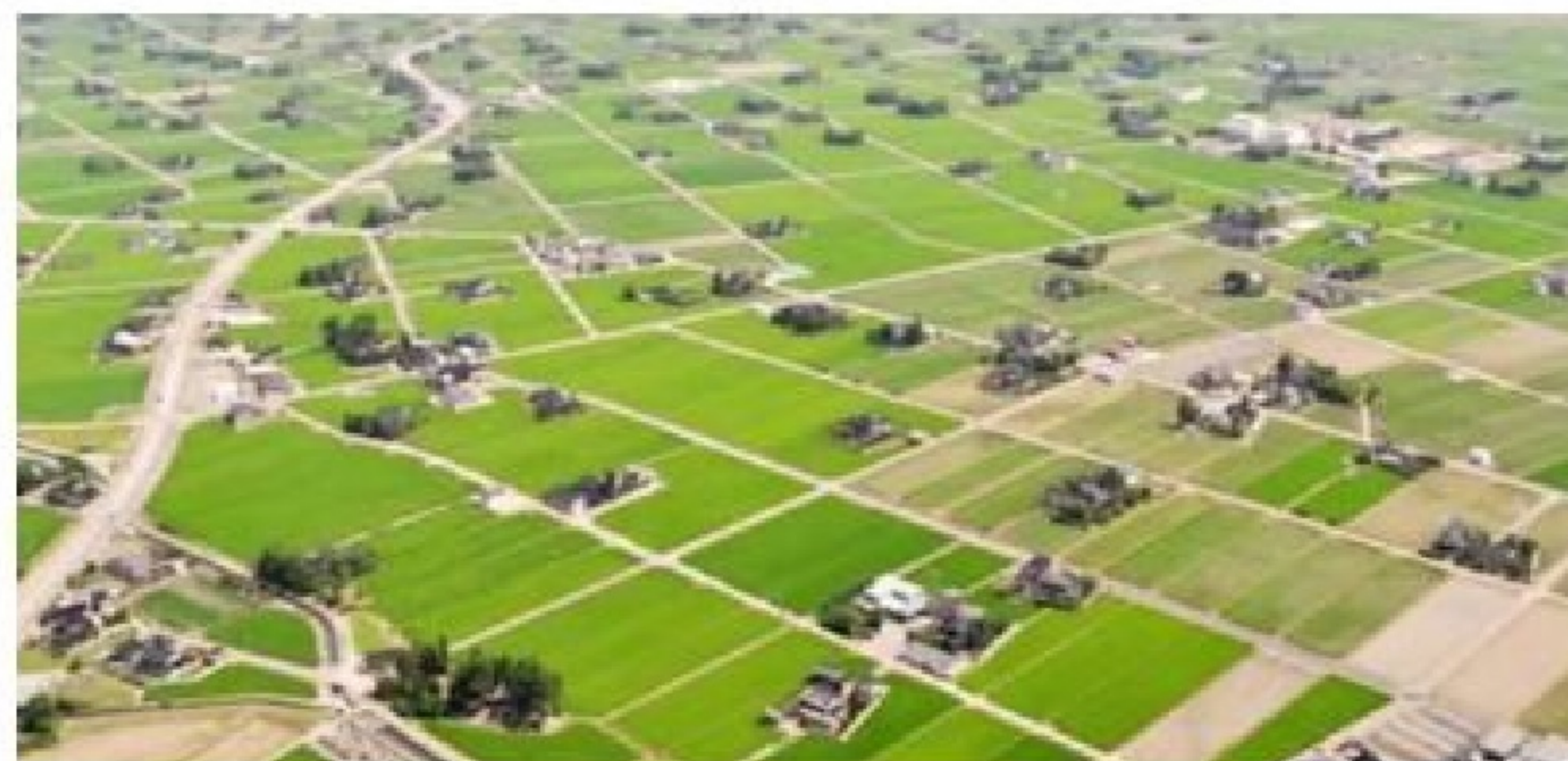
扇状地に広がる散居の状況（砺波市内）