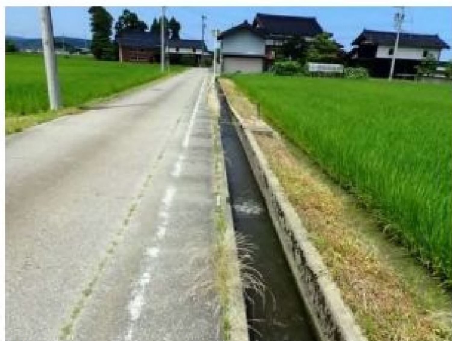
散居集落を流れる農業用水路(南砺市内)