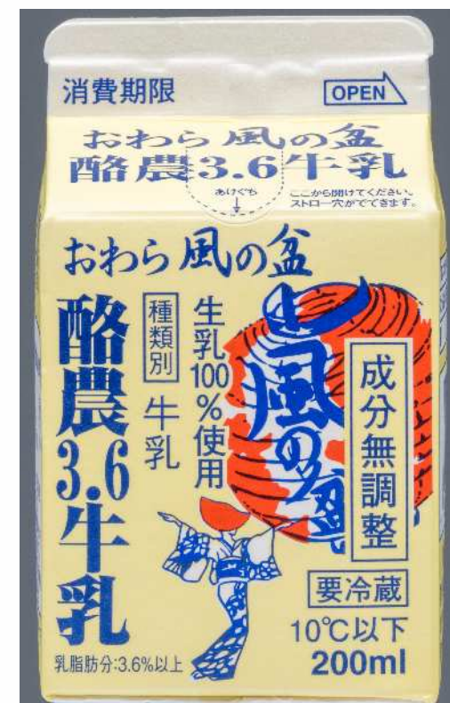
無料サービスする牛乳の例