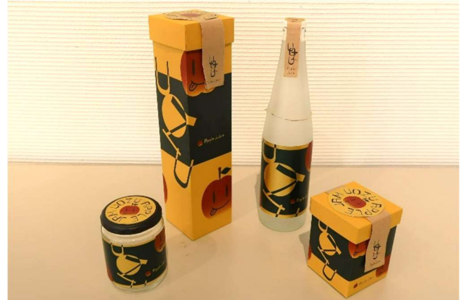
株式会社タイヨーパッケージ賞 「富山のりんごのジュースとジャムのビンをつつむ」 榎木 由樹 (創造社デザイン専門学校)