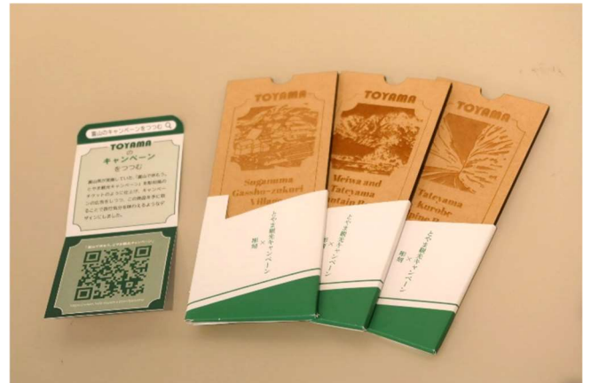
富山スガキ株式会社賞 「富山のキャンペーンをつつむ」 中村 菜々心 (安田女子大学)