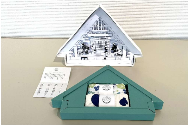
パッケージデザイン大賞 「富山の八尾和紙をつつむ」 福岡 芽依 (安田女子大学)