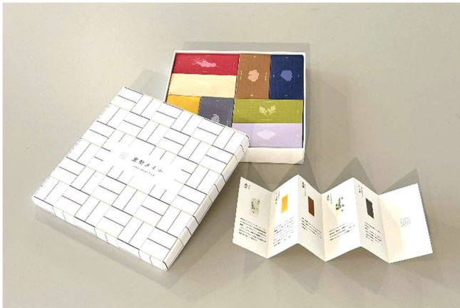
イセ株式会社賞 「富山のふるさとのお菓子をつつむ」 大石 芽依 (東京造形大学)