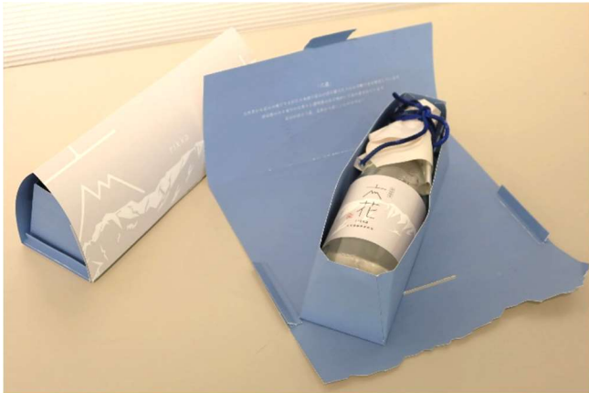
公益社団法人日本パッケージデザイン協会賞 「富山の万年雪をつつむ」 北山 萌華 (金沢情報 IT クリエイター専門学校)