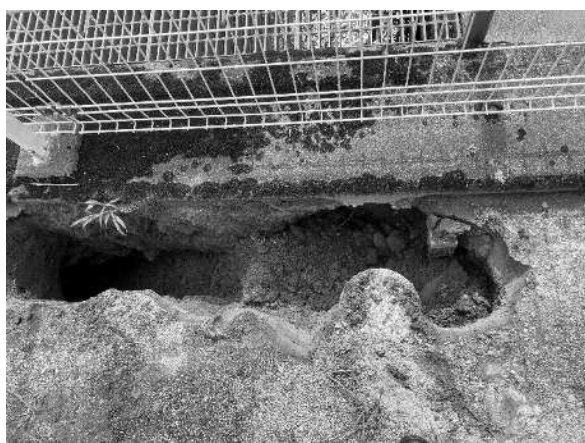
婦中中央児童館陥没箇所の状況