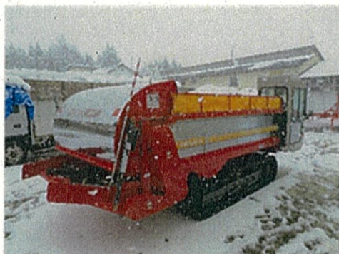
マニユアスプレッダー (自走式の堆肥散布機)