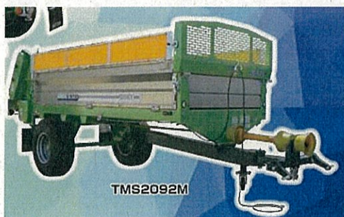
けん引式の堆肥散布機