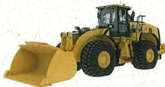
ホイールローダー