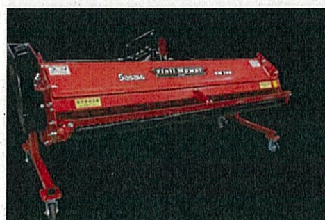
緑肥作物管理機（フレールモア）