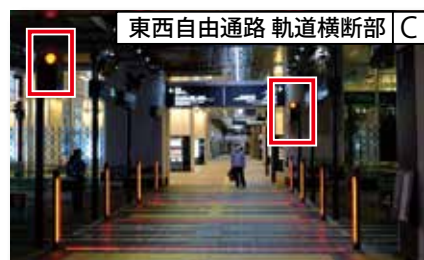
東西自由通路 軌道横断部 C