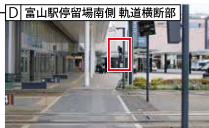
D 富山駅停留場南側 軌道横断部