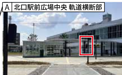
A 北口駅前広場中央 軌道横断部