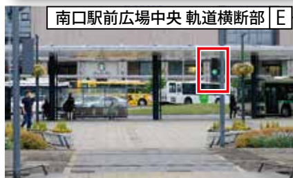
南口駅前広場中央 軌道横断部 E