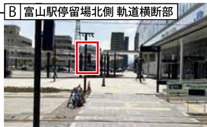
B 富山駅停留場北側 軌道横断部