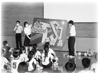
南中プロジェクト 校章旗