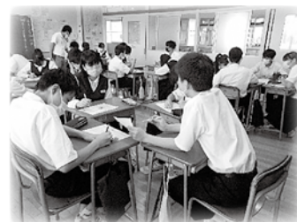
朝の学び合い学習