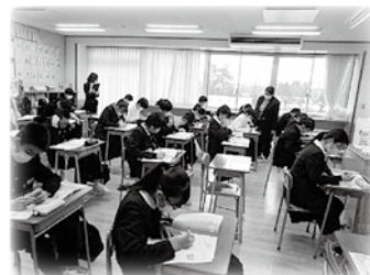
道徳科 授業研修会