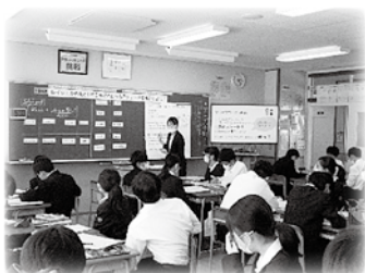
「学び合い」研修会授業