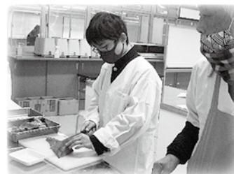
働く人に学ぶ講演会