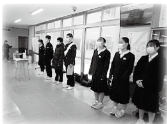
生徒会あいさつ運動