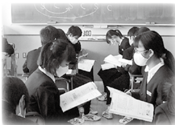
「主体的・対話的で深い学び」