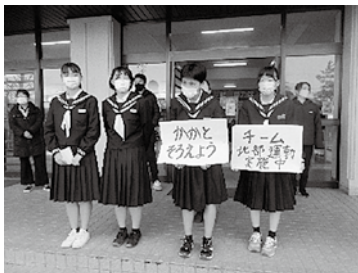
執行部、生活委員会による あいさつ運動