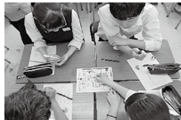
小グループで相談し合う