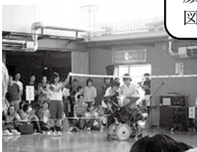
高志支援学校との交流

生徒会が、PTAの代表者と相談しながら、取り組んでいます。保護者や地域の方と顔見知りとなり、心の交流を図る機会となっています。