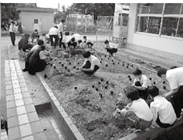
美化福祉委員会の花壇整備