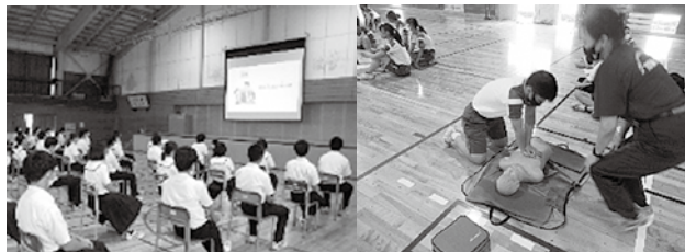
産婦人科医講演会

学年生徒会や保健委員会が中心となって、集会を開きます。また、専門医からの話を聞き、健康についての意識を高め、よりよい生き方を考えます。