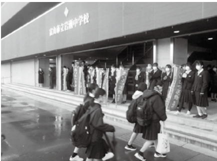
笑顔あふれる「あいさつ運動」