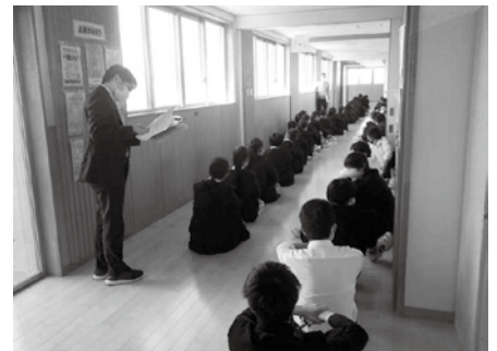
災害に備える「避難訓練」