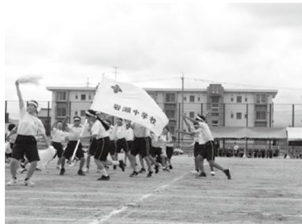
一致団結！体育大会