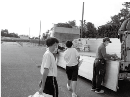
生徒が活躍する「資源回収」