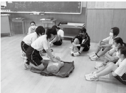
いのちを守る「海の安全教室」