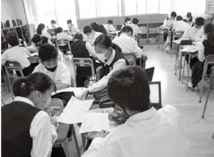
考えを深め合う「学び合い」