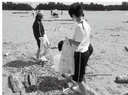
伝統の「岩瀬浜清掃」