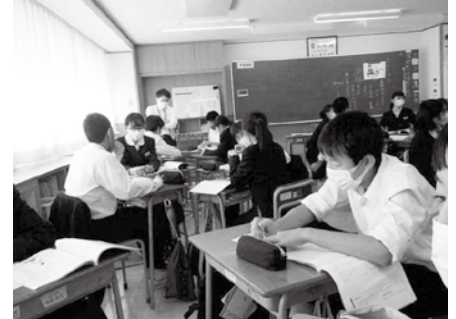
考え対話する道徳