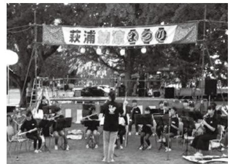
地域に貢献する岩中生