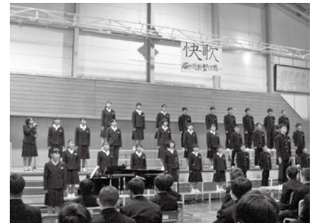
絆を深める合唱コンクール