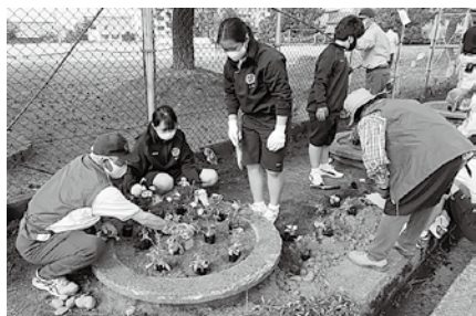
フラワーロード 植栽活動