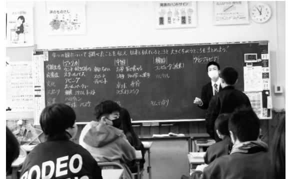
小学校での出前授業