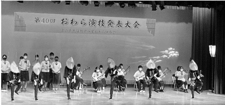
おわら演技発表大会