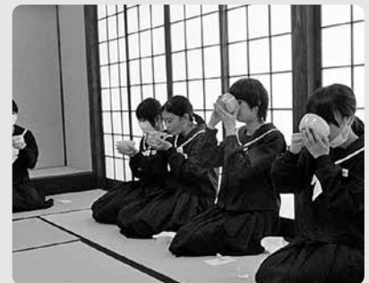
本格的な茶室「八尾のイエ」