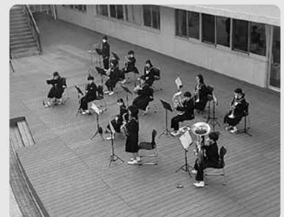
光と風を感じる「学びのニワ」