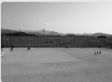
広大なグラウンドと雨の日もサッカーや野球の練習ができる「スポーツのニワ」