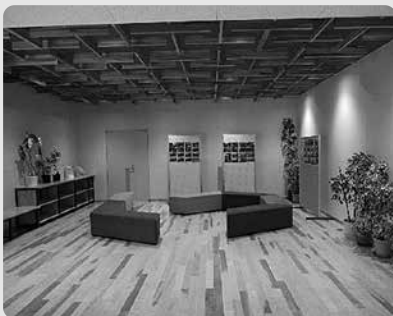
県産材をふんだんに使った学校ギャラリー・オープンスペース