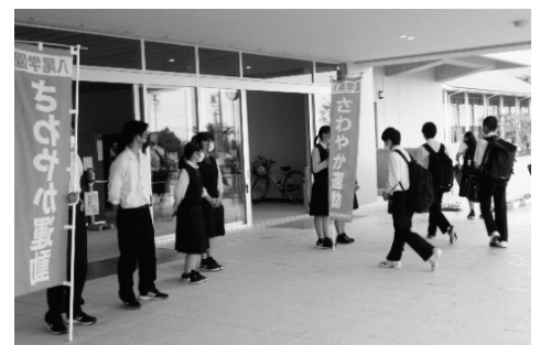
八尾学園挨拶運動