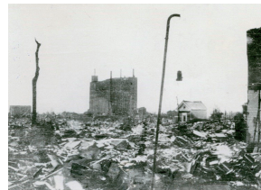
焦土と化した富山市街地