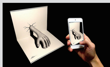
写真に撮るとより立体的に見えます