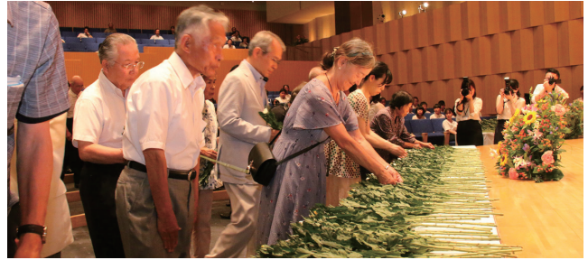
令和元年の一般献花

主催 富山市民感謝と誓いのつどい実行委員会・富山市 富山市自治振興連絡協議会 富山市社会福祉協議会 富山市遺族会 富山市老人クラブ連合会 富山市民生委員児童委員協議会 富山市児童クラブ連絡協議会 富山市母親クラブ連絡協議会 富山市PTA連絡協議会 富山市小学校長会 富山市中学校長会