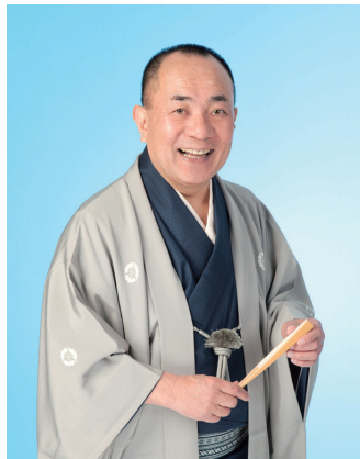
さんゆうてい こゆうざ 三遊亭小遊三さん