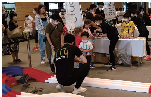
昨年のとやまレールライフフェスタの様子