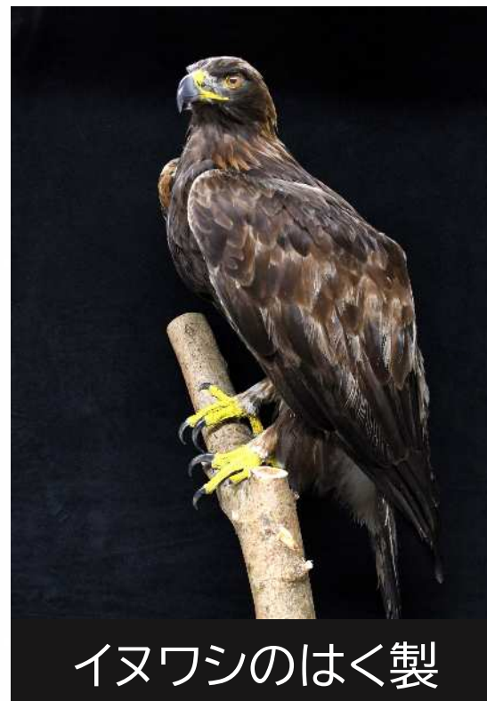
イヌワシのはく製