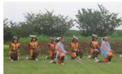
安田城月見の宴実行委員会 (朝日公民館内) ☎469-2495

1,000を超えるちょうちんが堀の水 面に映える光景や、よさこいの華やか な舞いなどをご覧ください。 期 8月26日(土)17:20～20:00 ※雨天決行。 所 安田城跡歴史の広場(婦中町安田) 内 少年少女武者行列、YOSAKOI in 婦 中祭、剣詩舞 など