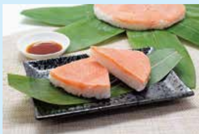
ます寿しの食べ比べもできます