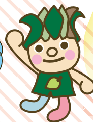
悠久の森の妖精 “もりりん”

会場：ファミリーパーク（開園9:00） 自然体験センター・六せん広場 （無料エリア）