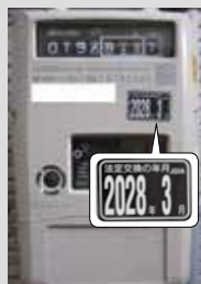
ガスメーター (有効期間10年) ※一部を除く。

メーターの見方がわからない時や、期限が過ぎていた場合の対応など、不明な点については問い合わせてください。