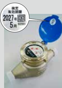
水道メーター (有効期間8年)