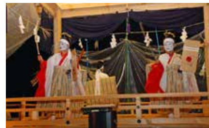
熊野神社稚児舞保存会(齊藤宅) ☎466-3320 熊生涯学習課 ☎443-2138

318年の歴史を持ち、「とやまの祭り 百選」にも選定された古式ゆかしい稚 児の舞をご覧ください。 期 8月25日(金)17:00～ ※雨天決行。 所 熊野神社(婦中町中名)