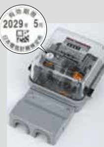
電気メーター (有効期間10年) ※一部を除く。