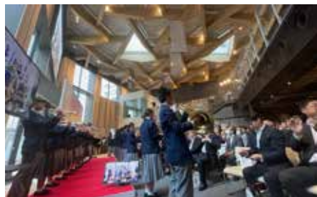
メインロビーで行われた開館記念式典

作った仏に魂を入れるのはこれからである。市民の皆さんの普段使いがあってこそ、寄って良し・観て良し・演じて良しの「マイホール」としての愛着が育まれ、ひいては芸術や文化・芸能を通した市民の「心の豊かさ」や「幸せ」につながってゆくのだと思う。