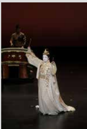
坂東玉三郎×鼓童 「アマテラス幻想」