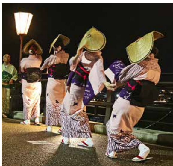
八尾町福島:令和4年9月2日撮影