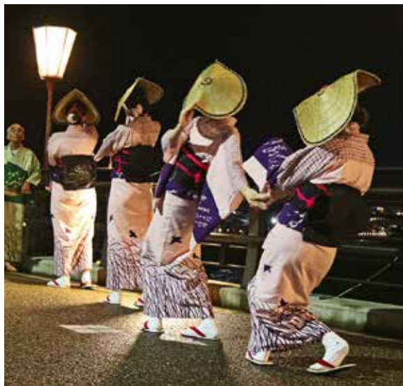
八尾町福島:令和4年9月2日撮影