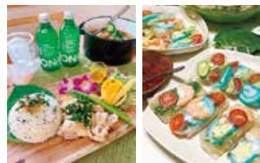
昨年のグランプリ料理