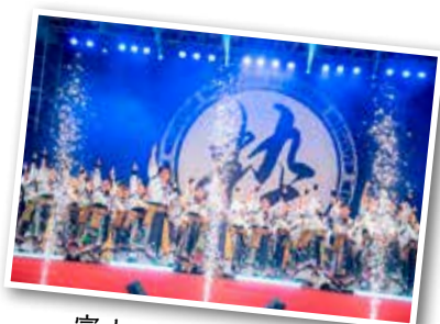
富山のよさこい祭り