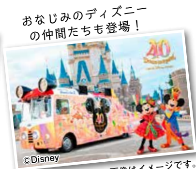
おなじみのディズニーの仲間たちも登場!