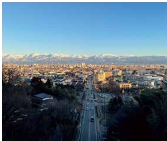
呉羽丘陵フットパス連絡橋から立山連峰が見えます。