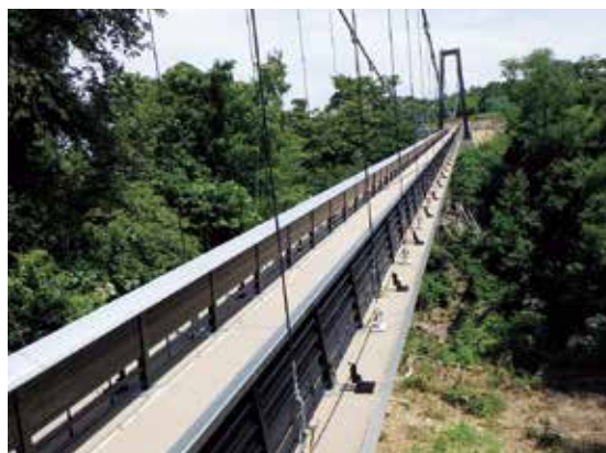
呉羽丘陵フットパス連絡橋(124m)