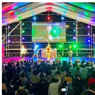
昨年のステージの様子

5日 (午後)富山の学生によるブラスバンド演奏、チャ リーディング、意見発表 など