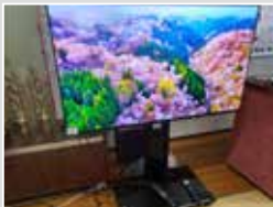
向新庄連合町内会

(一財)自治総合センターによる宝くじ社会貢献広報事業のコミュニティ助成を受け、令和5年度はテレビや炊飯器、椅子などを整備しました。