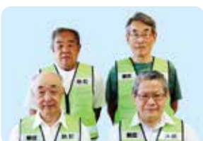
新庄校下防犯連絡協議会