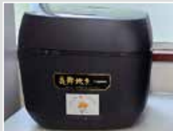
荏原駅前通り町内会