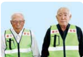
蛸川校下防犯組合連合会