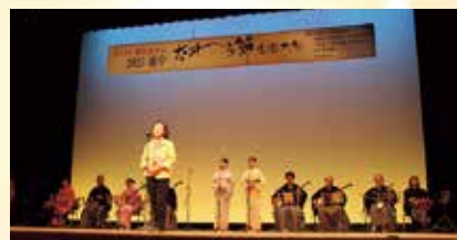
越中おわら節全国大会