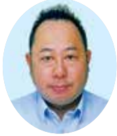
富山サンウエーブボランティアグループ