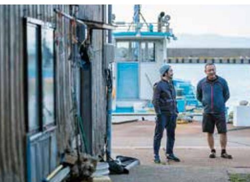
オール富山企画の第2弾公演「笑顔の砦 20 帰郷」のために市内の漁港を取材する様子