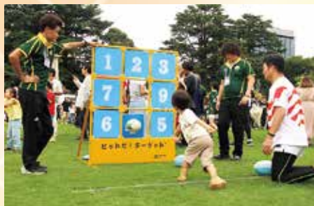
城址アスレチックパーク