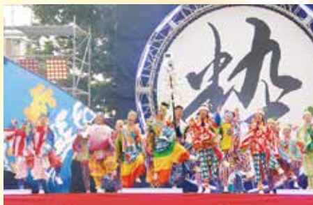
富山のよさこい祭り