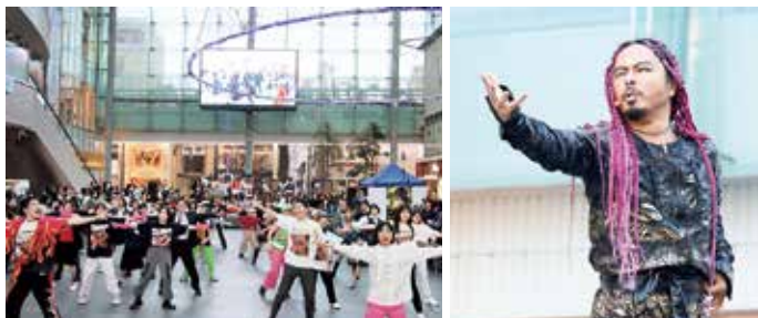
昨年のイベントの様子(グランドプラザ)