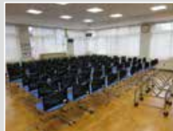
五番町地区自治振興会