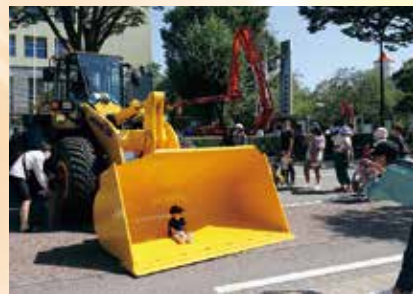
子どもに大人気「はたらくクルマ」