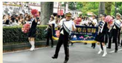
富山県警察音楽隊スペシャルパレード