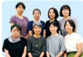
富山市立図書館「よみきかせの会」