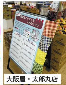
大阪屋・太郎丸店

南富山駅舎・大阪屋ショップ下堀店 / 太郎丸店・堀川中学校・富山高専・富山いずみ高校の6箇所で掲示中！見かけた方はぜひ投票してみてください。