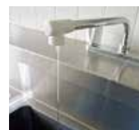
水が糸を引く程度

※止水栓(元栓)を閉じるだけでは基本料金がかかります。水道の使用中止を希望される場合は、上下水道局料金課または各上下水道サービスセンターへお問い合わせください。