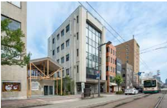
まちなか学生シェアハウスfil