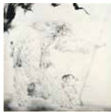
やまのば きんとき 山姥と金時