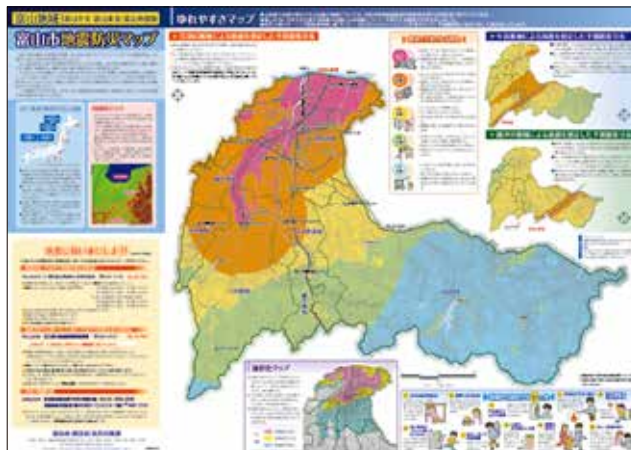
ゆれやすさマップ

自宅における地震対策や避難場所について確認して、日頃から地震に対する備えを心がけてください。