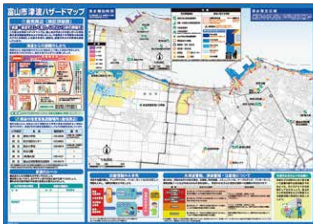
倉垣地区の津波ハザードマップ

倉垣、四方・八幡、草島、岩瀬、萩浦・豊田・奥田北、大広田、浜黒崎、水橋西部・三郷、水橋中部