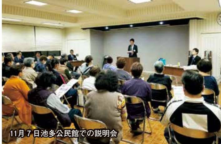
11月7日池多公民館での説明会