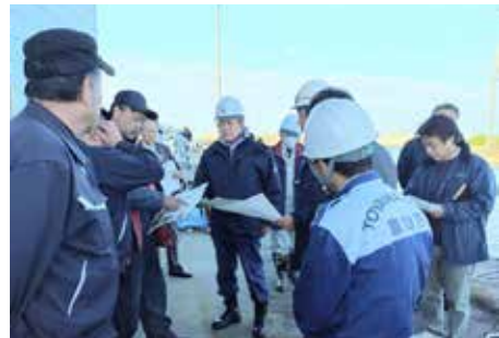
水橋漁港視察の様子

東日本大震災を経て国土交通省東北地方整備局が編集した『災害初動期指揮心得』に、「備えていたことしか、役には立たなかった。備えていただけでは、十分ではなかった。」という教訓がある。大規模災害に対する備えを早急に再点検し強化したい。(つづく)