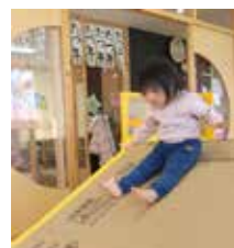
▲段ボールの滑り台