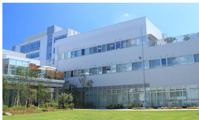
富山市まちなか総合ケアセンター（総曲輪レガートスクエア内：総曲輪四丁目） 【TEL】産後ケア応援室 076-461-3541 【URL】 http://machinaka-care.city.toyama.lg.jp/top.aspx