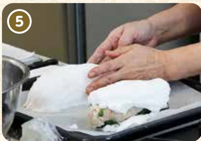
鶏肉を隙間なく覆ってオーブンへ