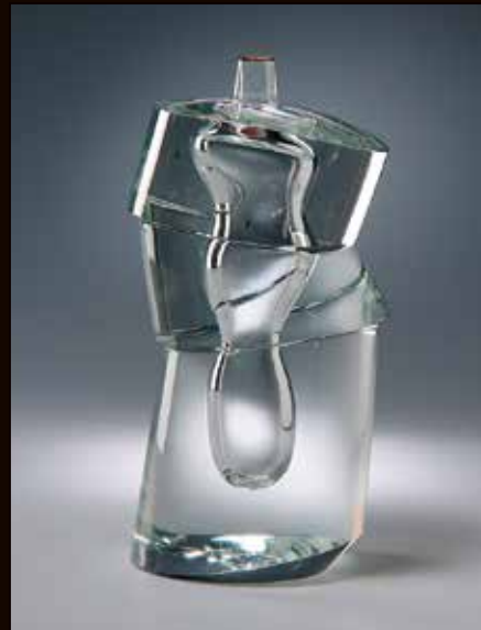
2.《クリスタッロ・ソンメルソN.49-彫刻》 2008年 Collection Barry Friedman, New York