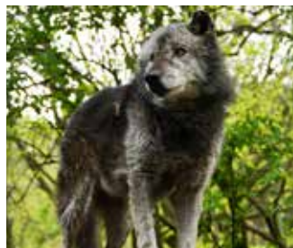
シンリンオオカミ