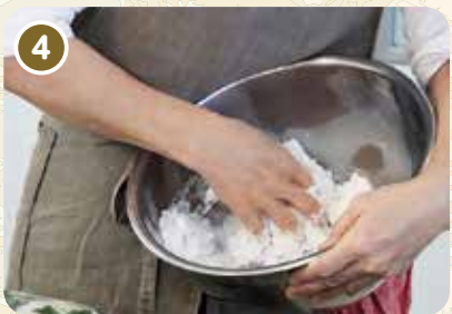
あら塩と卵白をふわふわに混ぜる