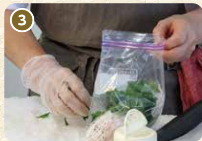
袋に鶏肉と葉を入れ一晩程度寝かせる