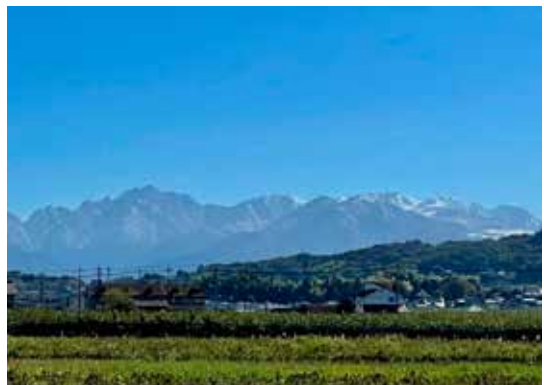
呉羽丘陵越しの立山連峰

何れにせよ、大地震の際には、「公助＝国や地方公共団体が取り組むこと」はもとより、まず「自助＝一人一人が自ら取り組むこと」と、「共助＝地域や身近にいる人同士と一緒に取り組むこと」が非常に重要になることを肝に銘じたい。(つづく)