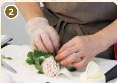
鶏肉にえごまの葉をまぶす