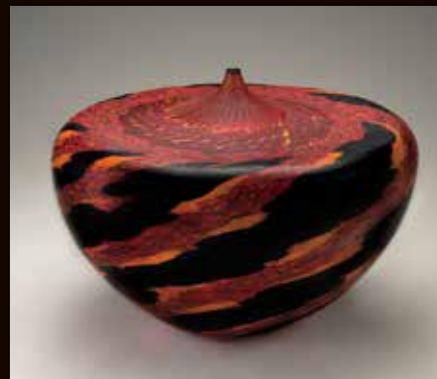
3.《溶岩の流れ N.22》 2005年 Collection Barry Friedman, New York