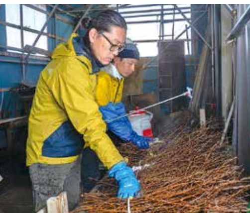
啓翁桜の出荷作業