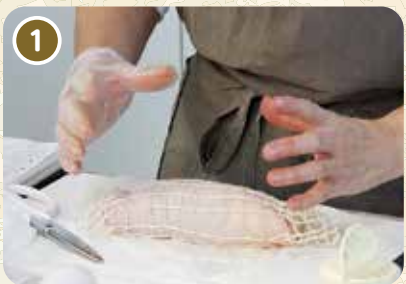
鶏肉をロール状にする

えごまの葉っぱ漬けチキンロールの塩釜焼きは、17ページで詳細なレシピを紹介します。