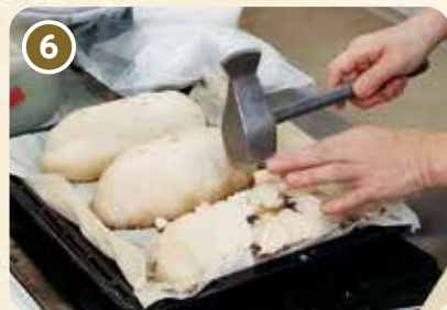
塩釜の余熱がとれたら叩き割る